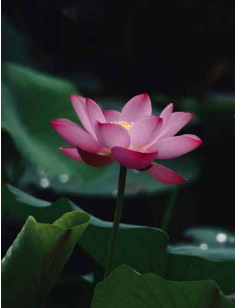
คุณแม่ทม ส่วน ตักดีดีวงศ์