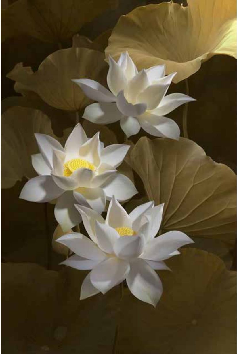
บันทึกธรรม๒ : สิ้นตัวตน พ้นสงสาร