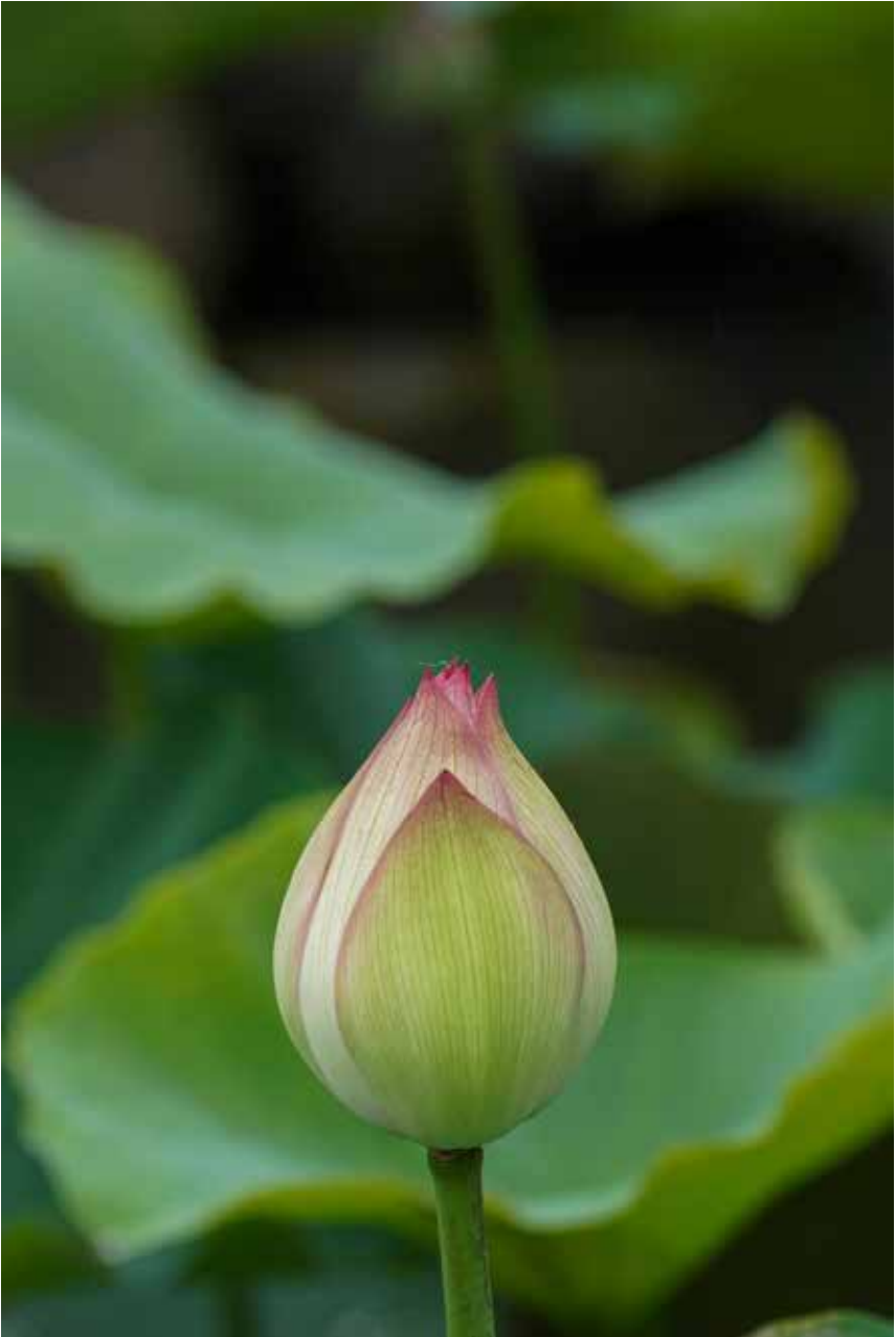
บันทึกธรรมชาติ : สิ้นตัวตน พันสงสาร