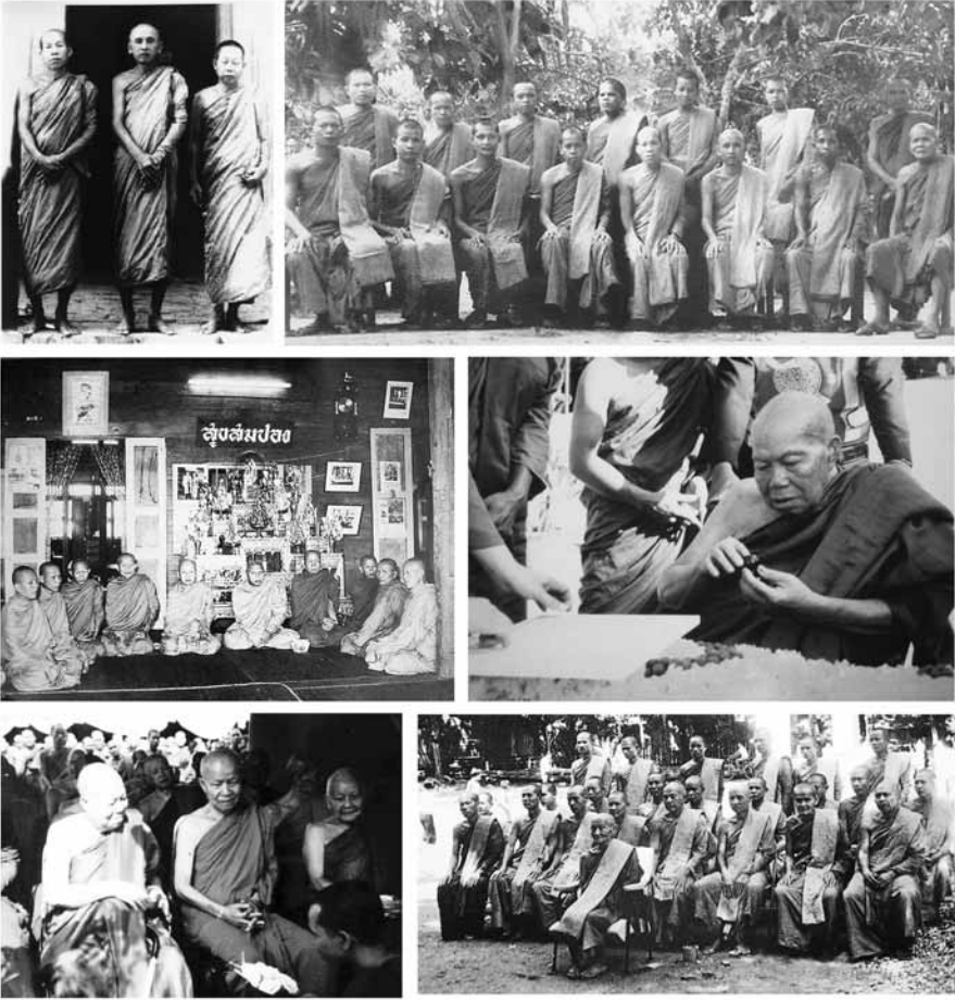
ประวัติ พระสุธรรมคณาจารย์ (หลวงปู่เหรียญ วรลาโภ) วัดอรัญญบรรพต อ.ศรีเชียงใหม่ จ.หนองคาย